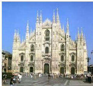
Piazza Duomo – Milão